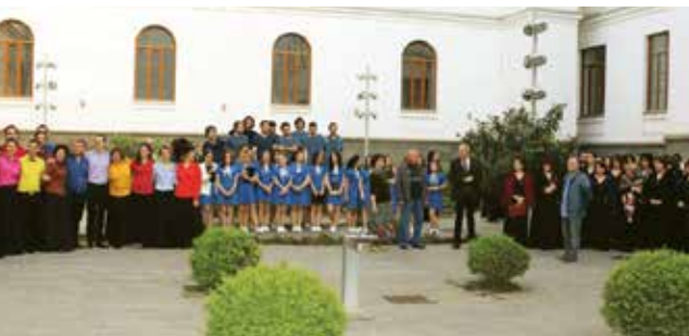
მსმენელისთვის. თბილისის საგუნლო მუსიკის VIII საერთაშორისო ფესტივალის საემიო დაბურვა 12 მაისს, 19:00 საათზე თბილისის სახელმწიფო კონსერვატორიის დიდ ღღეში გაიმართება.

ფესტივალი უკვე მერვე წელია გარდება და ღღეიერი ადგილი დაიკვლიდა როგორც ქალაქის კულტურულ ცხოვრებაში, ასევე საგუნლო მუსიკის მოყვარულთა შორის. მისი მიზანია ქართული საგუნლო სამშესრულებლო გრადაციების შენარჩუნება, განვითარება და პოპულარიზაცია; შემოქმედებითი ურთიერთობების დამყარება უცხოეთის საგუნლო კოლექტივებთან და მათი შემოქმედების გავრცელება ქართველი